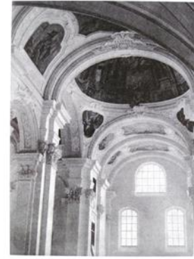
Baum 2. Das Mittelschiff der Kirche nach der glücklich vollendeten Restaurierung